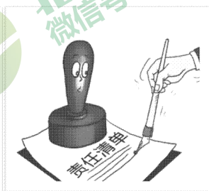
明确政府该怎么管市场，做到“法定责任必须为”