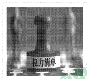
明确政府该做什么，做到“法无授权不可为”。

13. 国务院总理李克强提出政府要建立“三张清单”（“权力清单”“负面清单”“责任清单”）制度，用“清单”明确政府权责。列出三张清单，力推依法行政。依法行政的核心是