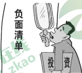
明确企业不该干什么，做到“法无禁止皆可为”。