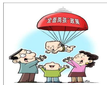
落地 新华社发 徐骏 作