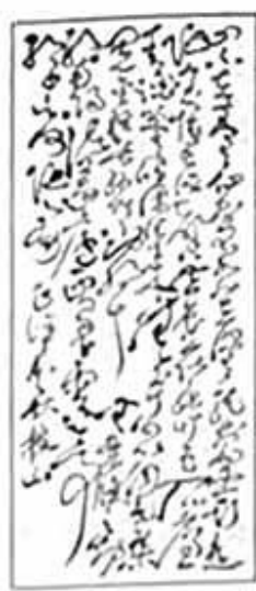
【乙】祝枝山书《陋室铭》