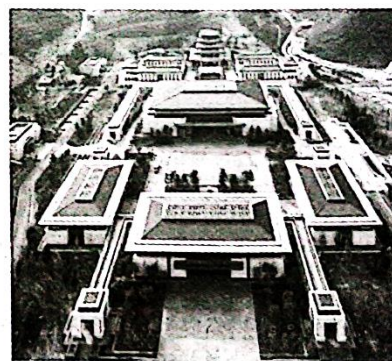
中国国家版本馆中央总馆

在这里，从贾湖龟甲、良渚黑陶、青铜方鼎一直走到聚首的《四库全书》，陶器、玉器、青铜、简牍、丝帛、纸张、绘画、雕塑淋漓尽致地写出了四个字：生生不息！