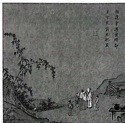
相逢幸遇佳时节 月下花前且把杯