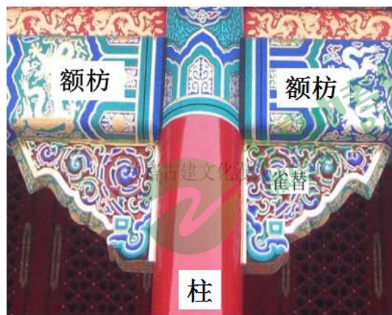
图 1 太和殿柱与额枋的燕尾榫卯连接

紫禁城古建筑的竖向构件（柱子）与水平构件（额枋）主要通过榫卯形式连接。榫卯，是在两个构件上采用凹凸部位相结合的一种连接方式。凸出部分叫榫（或叫榫头）；凹进部分叫卯（或叫榫眼、榫槽）。紫禁城古建筑的榫卯节点有数十种，太和殿柱与额枋连接为其中一种，称为燕尾榫卯节点。（见下图）