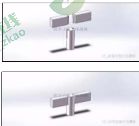
图 2 燕尾榫卯节点示意图