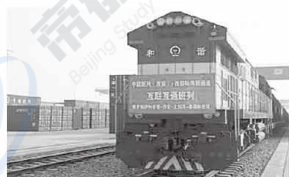
③共建“一带一路”项目中欧班列