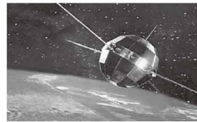
②第一颗人造卫星成功发射