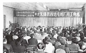
④乡镇企业异军突起