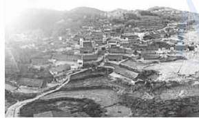
①“精准扶贫”首倡之地十八洞村