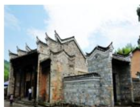
③井冈山茅坪村八角楼旧址