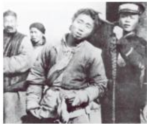
辛亥革命后军警为行人剪辫子