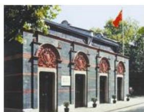
①中共一大上海会址