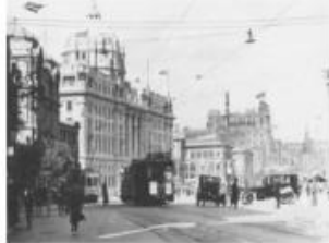
20世纪初的上海街道

材料二 电灯、自来水初出现时，上海市民曾十分恐惧，担心用电会“遭雷殛（诛，杀死）”……后来则非常欢迎电灯，称其“赛月亮”，“颇便行人”；开始市民“谓（自来）水有毒质，饮之有毒，相戒不用”，后来则“通装水管，饮濯（洗）称便”。