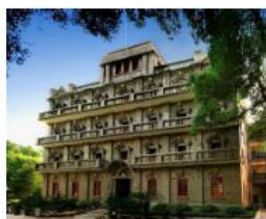
②南昌起义指挥部旧址