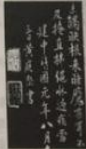
第四幅《奉同公择尚书咏茶碾煎啜三首》 (宋·黄庭坚)

6. 如果为茶室选择一副对联，上联为“石鼎火红诗咏后”，从下面句子中选择下联，最恰当的一项是(2分)