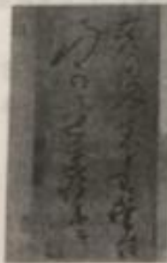
第一幅《苦笋帖》 (唐·怀素)