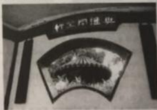
“与谁同坐轩”借景图

16. “与谁同坐轩”是苏州园林“拙政园”中的一个亭子，透过亭子的扇形窗户，可以看到旁边的“笠亭”及其周围的景物。请结合【材料一】和下面的图片，简要说说“与谁同坐轩”是如何借景的，其效果是什么。(4分)