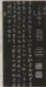
第三幅《茶录》 (宋·蔡襄)