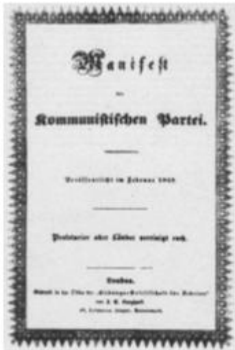
《共产党宣言》封面(1848年出版)

34. (5 分) 某同学在学完第一次世界大战这一课后，自制了一份复习提纲。请你根据下面所给信息，帮他完成学习提纲内容。