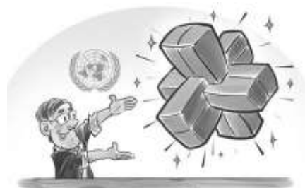
大众日报 唐浩鑫 作