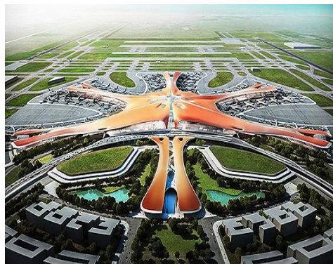
北京大兴国际机场

奇迹之二，世界施工技术难度最高的航站楼。首次有高速铁路在地下穿行，首次采用双层出发双层到达设计，一、二层分别为国际到达和国内到达，三、四层是出发层，办理值机手续。建设的局部五层，专门设置了“亲友话别区”。【甲】。