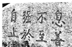
厦门大学:自强不息 止于至善

6. 学生会同学在探究“自强不息”时代价值时发现,不少大学以“自强不息”作为校训彰显其精神内涵。请欣赏以下两所大学校训石书法作品,其中鉴赏有误的一项是(2分)