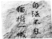
兰州大学:自强不息 独树一帜