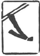
自由式滑雪 空中技巧

A. 美丽轻盈的身姿腾空一跃，平稳落地，这娴熟的动作背后，是选手对技术精益求精的追求。