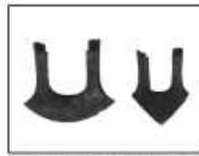
春秋时期的铁制农具