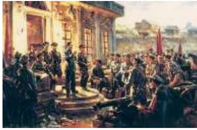
图1 南昌起义 (油)