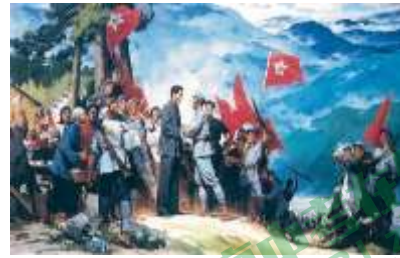
图2 井冈山会师 (油)