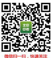
微信扫一扫，快速关注