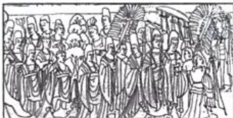
北魏帝王出御图(河南出土)