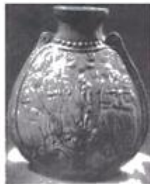
胡旋舞扁陶壶(河南出土)