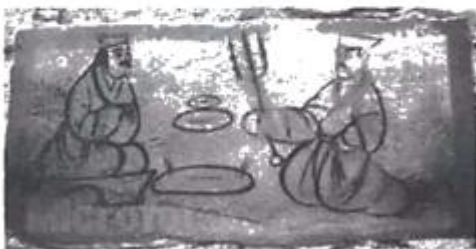
汉人胡食图(甘肃出土)