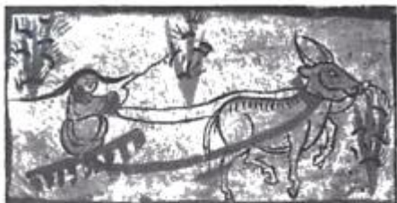
少数民族用牛耙地图(甘肃出土)