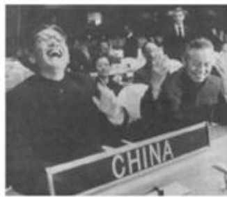
图二 乔冠华开怀大笑