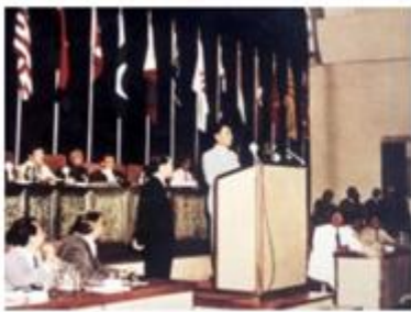
图一 周恩来出席万隆会议