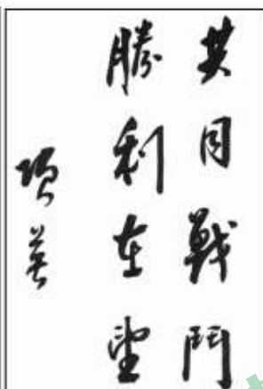
C. 共同战斗，胜利在望 (项英)