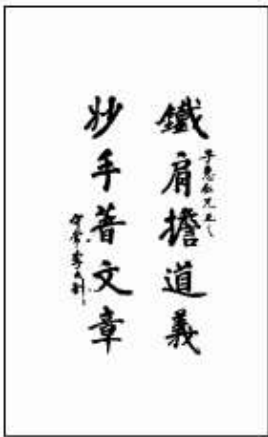
A. 铁肩担道义，妙手著文章 (李大钊)