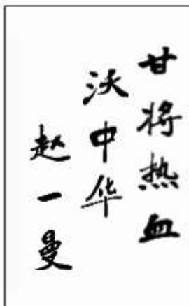
B. 甘将热血沃中华 (赵一曼)