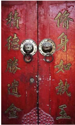
修身如执玉 积德胜遗金

4、老北京胡同里的对联,是一道古雅的风景区。请任选一副对联,从书体特点及书写内容两方面分别谈谈对联传递出老北京人怎样的精神追求。(2分)