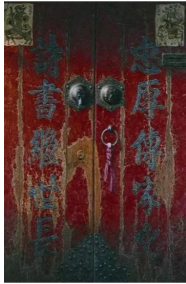
忠厚传家远 诗书继世长