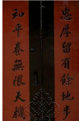
忠厚留有余地步 和平养无限天机