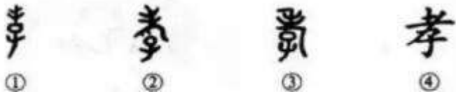
甲骨文 金文 小篆 楷书

从“孝”字的字源来看,甲骨文的孝字像一个孩子搀扶老人之形,本义为孝顺。金文的孝字,上部是驼背“老人”,“老人”之下有“子”(小孩),小孩扶持老人行走之意。