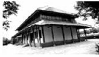
图3：殷墟宫殿复原图