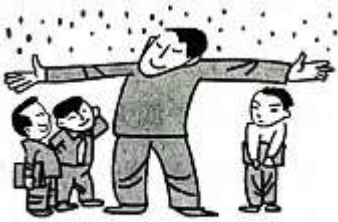
你把自己当伞，处处有朋友 你把别人当伞，处处失朋友