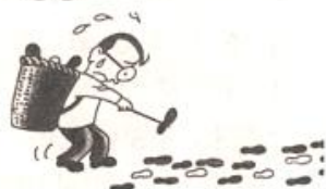
图3 谁的道路适合我