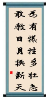
【丁】录毛泽东《七律·到韶山》诗句