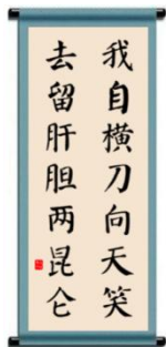
【甲】录谭嗣同《狱中题壁》诗句

3. 学校举行“书不朽，法自强”学生书法作品展。下面对其中四幅书法作品的欣赏，不恰当的一项是(2分)