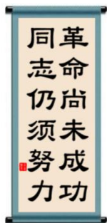
【乙】录孙中山在恩亲大会上的题词