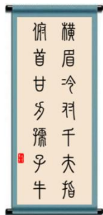
【丙】录鲁迅《自嘲》诗句