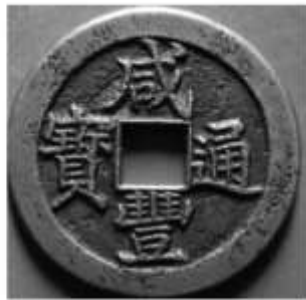
(乙) 清代 咸丰通宝