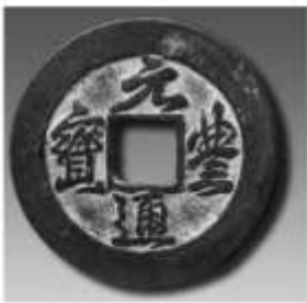
(丙) 宋代 元丰通宝