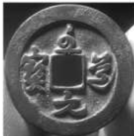
(丁) 宋代 至道元宝