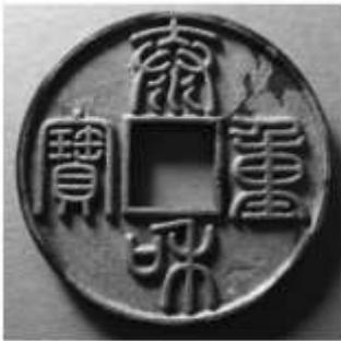
(甲) 金代 泰和重宝

4. 货币是历史的实物，更是历史的见证。一些同学通过品析古代钱币上的汉字体会中国传统文化。下面是同学们分享的古代钱币图片，对这几幅图的欣赏不恰当的一项是 ( )