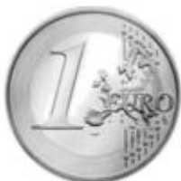
1 欧元硬币的统一图案

材料三 欧元硬币一面为统一的图案，形象是面值加上一幅欧洲地图，旁边由代表欧元区 12 个成员国的 12 颗小五角星相绕，另一面则由各国自定。