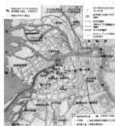
彼得格勒武装起义形势图

29. 罗斯福新政期间，美国颁布了《全国工业复兴法》等一系列法律，以应对危机。这些措施表明新政的实质是