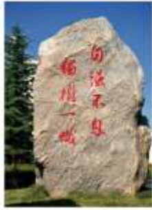
厦门大学：自强不息 止于至善