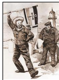
德国向英国发起挑战(漫画)