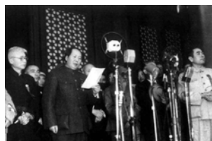
《共产党宣言》书影 攻占冬宫 中共一大上海会址 开国大典