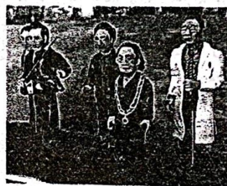
郎佳子或面塑作品