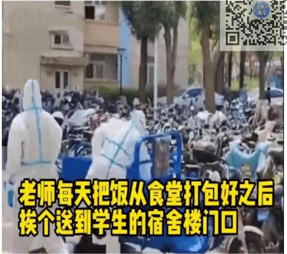
老师每天把饭从食堂打包好之后挨个送到学生的宿舍楼门口

2022年3月，上海嘉定一名29岁的社区医生投入到一线核酸检测工作中，从中午进小区开始核酸采样，直到晚上七点结束，双手变得皱巴巴好似老人。辛苦了！