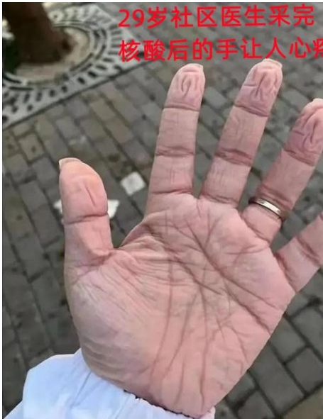
29岁社区医生采完核酸后的手让人心疼

2022年3月，上海嘉定一名29岁的社区医生投入到一线核酸检测工作中，从中午进小区开始核酸采样，直到晚上七点结束，双手变得皱巴巴好似老人。辛苦了！