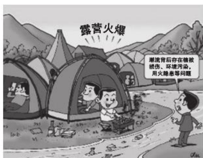
火爆背后有隐患 新华社发 徐俊 作

20. “周六一起去露营吗？”近年来，露营经济火爆，在带动旅游的同时也显露出一些问题：露营地品质良莠不齐，未经开发的营地存在诸多安全隐患，还有植被破坏、垃圾处理等问题。促进露营经济持续健康发展，需要政府（ ）