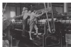
18 世纪工业革命时期童工劳动