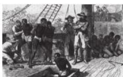
16 世纪欧洲殖民扩张