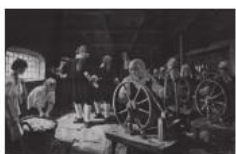
14 世纪佛罗伦萨的工场

2. 下列图片反映了资本主义产生与发展过程中的几个片段。对此解读不正确的是（ ）