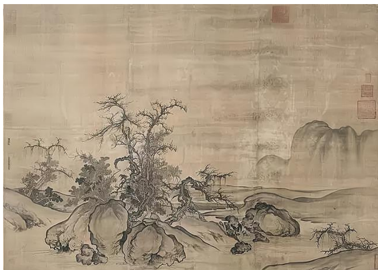
宋代画家郭熙《窠石平远图》

19. 宋代画家郭熙在山水取景构图上创立了“三远”法，“山有三远，自山下而仰山巅，谓之高远；自山前而窥山后，谓之深远；自近山而望远山，谓之平远。……高远之势，突兀深远之势突兀，平远之意冲融而缥缈缈缈。”同样都是“远”，意境却不同，这其中蕴含的哲理是（ ）