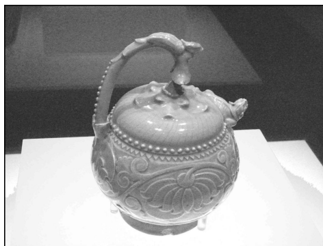
青釉提梁倒注壶照片