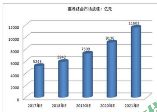
图 2. 2017-2021 年医养结合市场规模趋势图