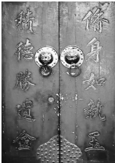
(1) 修身如执玉 积德胜遗金

3. 老北京胡同里的对联，是一道古雅的风景区。请你任选一副对联，从内容方面谈谈对联传递出了老北京人怎样的精神追求。（2分）