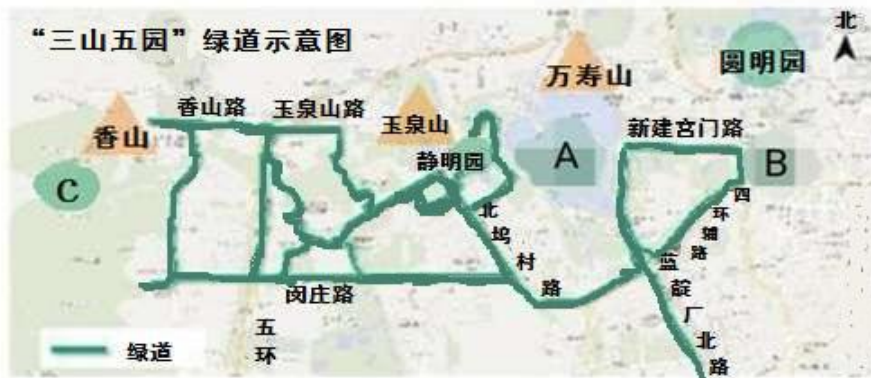
“三山五园”绿道示意图

本着对历史和人民负责的态度，整体保护利用好“三山五园”这张金名片，北京市特别修建了“三山五园”绿道。