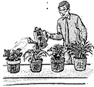
建立国家助学金制度