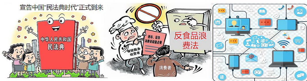
《中华人民共和国民法典》