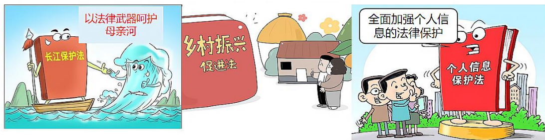
《中华人民共和国长江保护法》