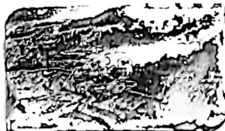
活动二 “希望的田野” 探访美丽乡村新变化

某地是传统矿山县,贫困发生率曾高达30.3%。穷则思变,该县在政策导向下,大力关停矿山,积极发展林果业、休闲旅游业。曾经干旱荒凉的贫瘠之地,经过因地制宜的治理,聚水节水保水,变成了核桃丰产的宝贝山,引得游客纷至沓来。