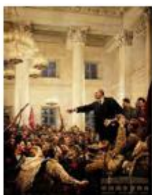
图 1 列宁宣布人民委员会成立