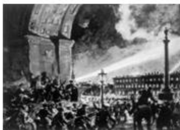
图 4 攻占冬宫