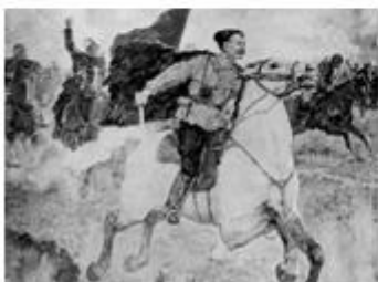
图 3 战斗中的红军指挥官恰巴耶夫