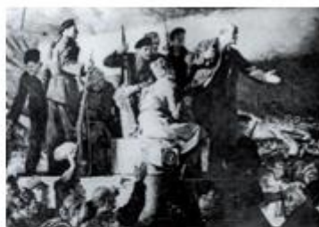
图 2 列宁回到彼得格勒