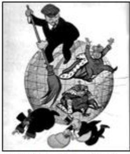
图5《列宁同志清扫地球》(漫画)