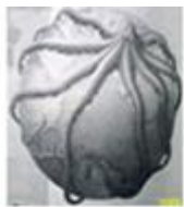
大危机笼罩下的世界

7. (2分) 如图漫画将 1929 年 - 1933 年资本主义经济危机比作笼罩全球的巨大章鱼, 形象地反映了经济危机的特点之一是 ( )