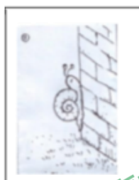
小蜗牛沿着光滑的墙壁往上爬。

题目二：下面的几幅图也许引起了你的思考，也许激发了你的想象。请选择其中一个角度写一则故事或结合你的生活实际写一段感悟。