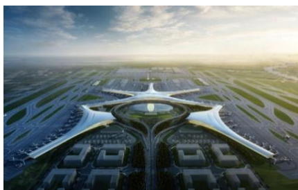
青岛新国际机场俯视图

可换乘地面交通；同时还能让人一下飞机就感受到青岛扑面而来的海洋文化，实乃一举多得。