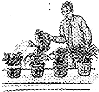
建立国家助学金制度