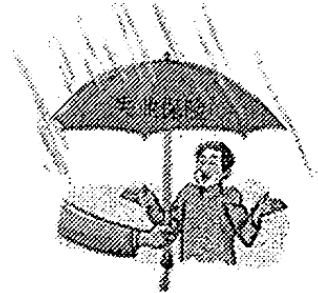
完善失业保险制度