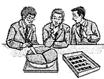
改革收入分配制度