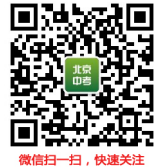
微信扫一扫，快速关注