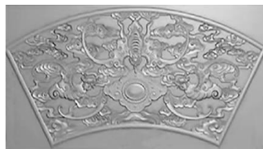
磨砂玻璃的蝙蝠图案花窗