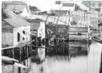
改革开放前的深圳深圳新