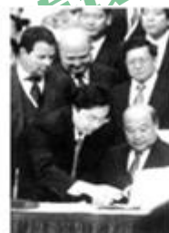
图2 中国代表签字加入世贸组织