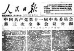
图3 十一届三中全会公报