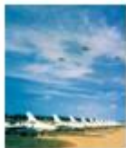
人民空军严阵以待