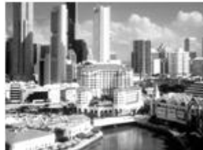
改革开放后的深圳