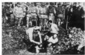
图 1 日军活埋南京和平居民

26. (13 分) 为了纪念中国人民抗日战争暨世界人民反法西斯战争的胜利，学校举办了以抗日战争为主题的展板。下面是学生搜集的关于抗日战争的历史图片资料。