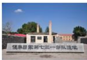
图 5 侵华日军七三一部队遗址