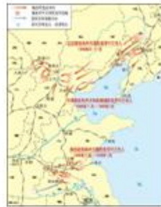
图2 三大战役示意图