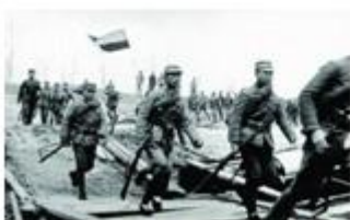
图 4 台儿庄战役中的中国军队