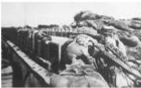
图 2 二十九军在卢沟桥抵抗日军