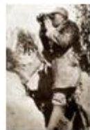
图 3 彭德怀在百团大战前线