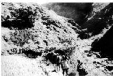
图3 刘邓大军到达大别山