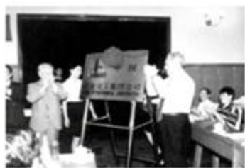
图1 中国石油、石油化工工业国有资产重组

(1) 小甲收集了以下图片，其中图(填序号)所体现的内容，标志着我国开始进入改革开放的新时期。