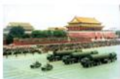
阅兵中的导弹部队

25. (2分)某历史兴趣小组在自主学习时从网络上收集了以下几幅图片,最符合这组图片主题的是（ ）