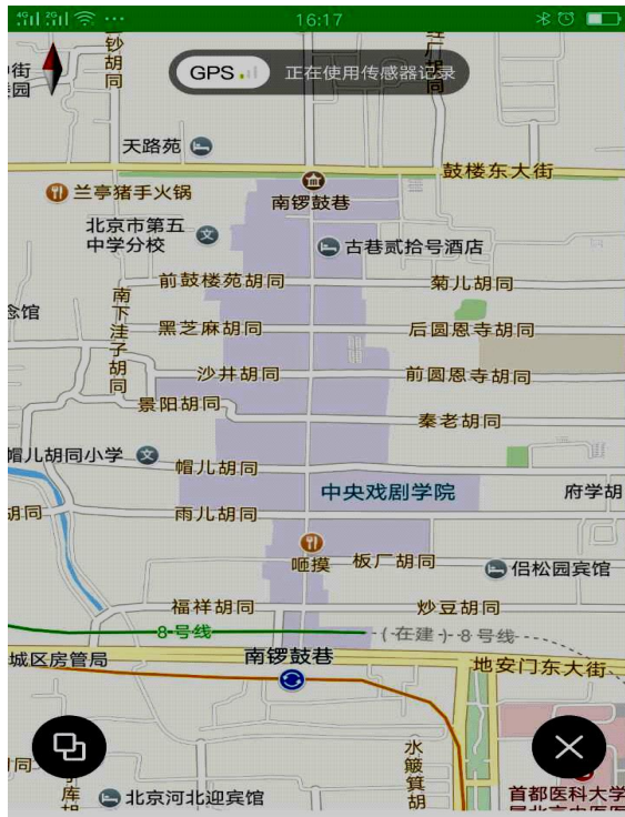
图一南锣鼓巷胡同分布图