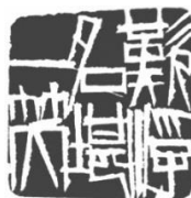
齐白石“叹浮名堪一笑”