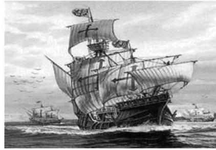
图一 哥伦布航海之船

材料二 如图二是以蒸汽为动力的“克莱蒙号”轮船。在此船之前，水面航行船只以人力和风力作为动力，而以蒸汽为动力的“克莱蒙号”轮船于1807年8月17日在哈得逊河试航，并取得成功；它是由美国人富尔顿建造的。