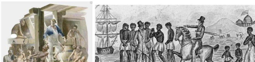
图三 行驶在大西洋上的贩奴船船舱和抵港的情景

材料三 如图三是一艘行驶在大西洋上的贩奴船船舱和抵港的情景。英国船运业中心利物浦的一位作家这样写道：“我们的港口是靠非洲奴隶贸易积累起来的资本建立的，是以活人的血肉为代价奠定了我们事业的基础。”