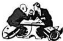
图2 美苏的“较量”：古巴导弹危机